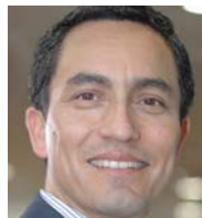
MOISÉS CERNA SEGUROS SURA