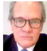
CRISTIAN REITZE ANIM A.G.